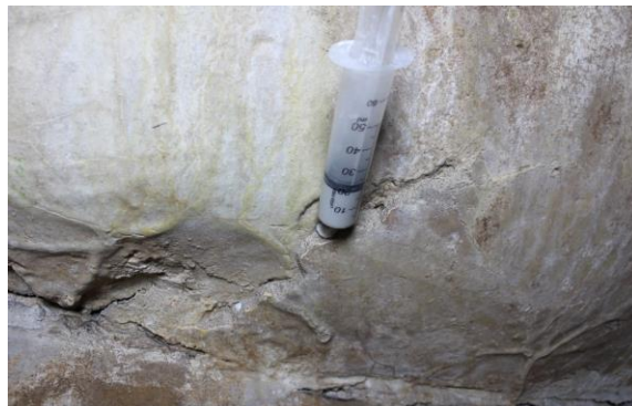
Bocca di lupo – lesione e distacco dell'intonaco prima e durante il consolidamento