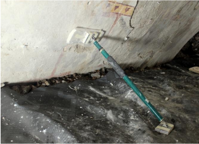
Puntellamento durante il consolidamento