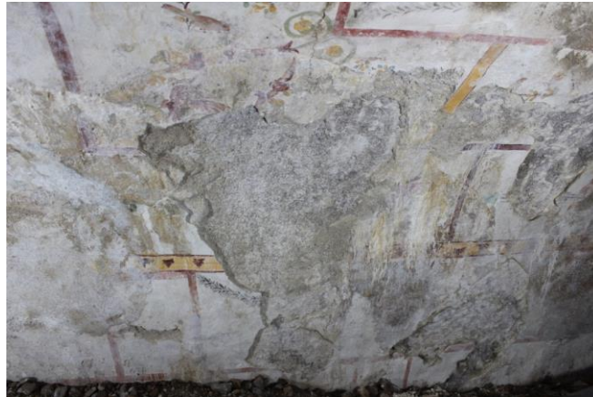
Particolare dopo il consolidamento e la sigillatura delle fessurazioni