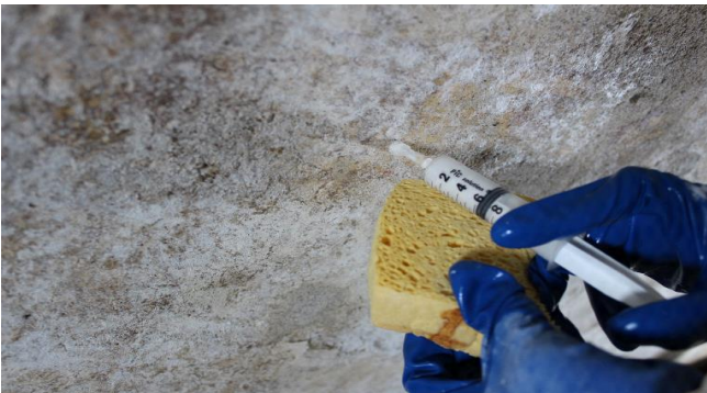
Particolari durante il consolidamento