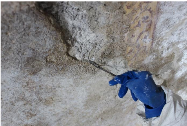
Stuccatura delle fessurazioni e dei margini