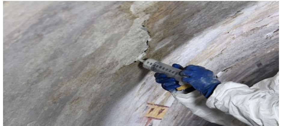
Lato Ovest – intonaco dipinto distaccato – prima e durante l'intervento